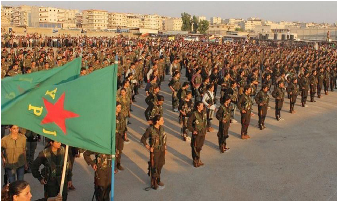
YPJ, a milícia curda especificamente feminina

Entre os fundadores do PKK tivemos uma mulher, Sakine Cansız, assassinada em Paris, cujo crime ainda não foi resolvido. A presença de mulheres no movimento aumentou progressivamente e logo eles formaram sua própria organização dentro do partido. Com as mudanças sucessivas no partido, o grupo de mulheres foi se reorganizando e renomeando, até chegar à forma de organização que hoje as mulheres têm dentro do PKK (por sua vez integrado à KCK). As mulheres do movimento de libertação curdo que atuam na Turquia estão organizadas em três organizações de mulheres: PJAK, o movimento ideológico das mulheres; YJA, o movimento social das mulheres e YJA-Star, a força de autodefesa das mulheres. Estas três organizações são coordenadas