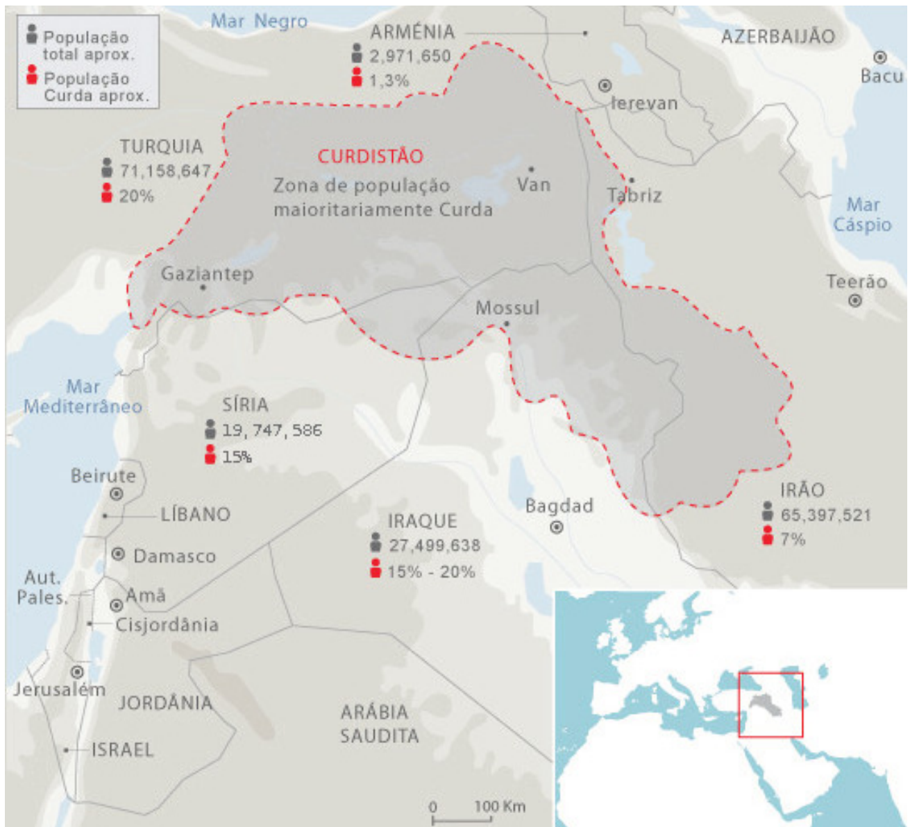
Curdistão e a população curda. Infográfico feito pelo jornal O Público, de Portugal

federalismo Democrático é realizada pelo Partido por uma Vida Livre no Curdistão (PJAK). No Curdistão iraquiano têm sido tradicionalmente fortes o PDKI socialdemocrata e comunista Komala, mas com a expansão das ideias de Öcalan e o exemplo da luta do PKK, seguidores dessas ideias e movimento fundaram em 2004 o PJAK, que tem ganhado progressivamente muita influência e força entre os curdos do Irã. As ideias do Confederalismo Demo-